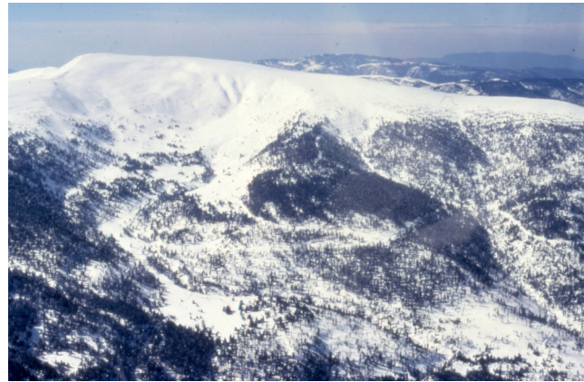
Els Clots de Roní el 25 de març del 1981. Al fons a la dreta, el Boumort i més al fons, el Montsec.

del Comte, tot el Cadí, el Moixeró, la Tossa d'Alp i el Puigllaçada, el Puigmal, els cims d'Aranser i Andorra. Actualment, tot aquest tram està trepitjat per l'estació d'esquí. Des de la Serra Seca es remunta per una ampla pista forestal fins a l'Eixida de Montnartró (2.190 m), un pla extraordinari que eixampla l'anterior vista a l'altra banda, al Saloria (2.789 m), el més alt de l'Alt Urgell, el Pic de Coma Pedrosa, el més alt d'Andorra (2.942 m),