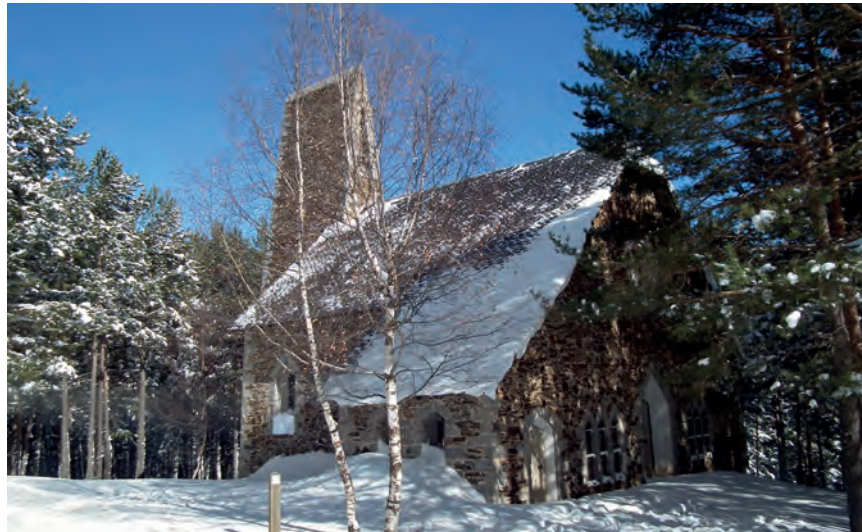
L'Erm nova de Sant Joan, a la Basseta.

Fa molts decennis que a l'estranger no s'entén una estació d'esquí alpí sense pistes d'esquí nòrdic, o una d'esquí nòrdic sense, ni que sigui, algun petit telesquí per òbvia diversificació de l'oferta. Però l'enllaç segueix per fer. Pitjor, segueix per plantejar-se seriosament prop de 50 anys després