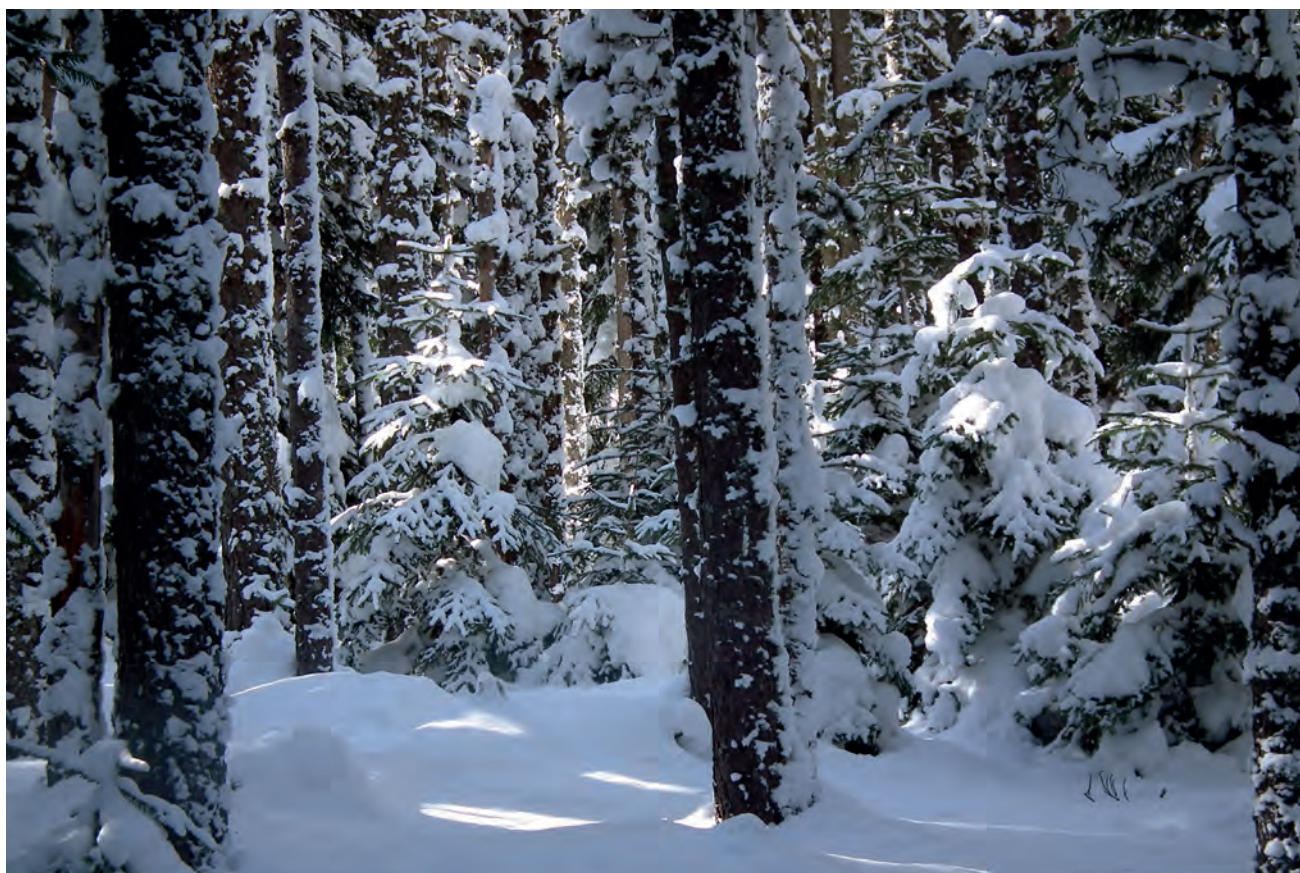
Els boscos de Sant Joan de l'Erm".

de la descoberta de Sant Joan de l'Erm; 34 anys després del treball del 1983 i 31 anys després de la posta en marxa de "Portainé". El treball del 1983 plantejava una suggestiva i econòmica xarxa de 8 estacions d'esquí nòrdic connectades, accessible per carretera des de diverses valls i pobles del Pallars i l'Alt Urgell: la casa forestal de Pallerols, la Basseta, el Port del Cantó, el refugi de les Comes de Rubió, "Port-Ainé", Romadriu - Sant Joan vell, el refugi del Ras de Conques (Ars), les bordes de Civís,... un veritable paradís de l'esquí nòrdic i a l'estiu del ciclisme de muntanya i l'excursionisme familiar. El què comentava al número 372 sobre el "Regional planning" de la Generalitat republicana, que encara no s'ha sabut recuperar perquè avui ni tan sols s'entén.