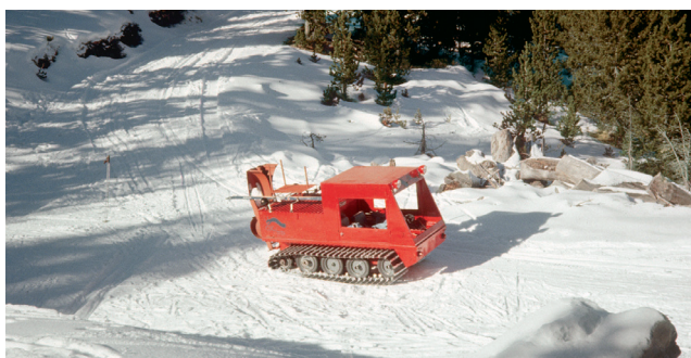
Pista del Gallfer al Llau dels Tarterals a l'Eixida de Montnartró (cota 2.100 m) amb la màquina eruga construïda ad hoc l'any 1976 per marcar les pistes d'esquí nòrdic. Va ser la primera i única de construcció íntegrament nacional. Desembre 1977