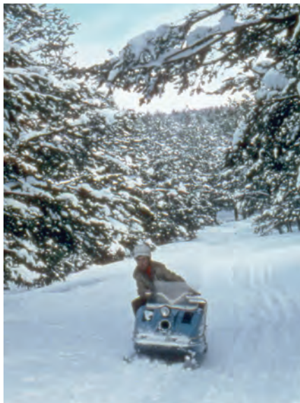
L'autor marcant pistes amb la moto de neu. 1971.

Bohí amb tot el romànic, permetent una planificació viable i respectuosa de tots aquests extraordinaris recursos per a les tres comarques: Pallars Jussà, Pallars sobirà i Alta Ribagorça. El ferrocarril hauria evitat desgràcies com la d'Espui, les especulacions immobiliàries en general i l'impacte s'hauria concentrat en els més de 40 pobles que recorria i servia, i que avui estan mig despoblats, i més especialment en els nuclis principals de Tremp, la Pobla, Vilaller i el Pont. És el model "suís" (i austríac) que fins i tot van adoptar els Alps francesos ja fa molts anys. El que he explicat breument de Llessui es detallava en el número 852 d'abril. Com anècdota i tot a l'inrevés del que hauria calgut, la seva difusió a la premsa va ser censurada per les pressions d'un conseller del llavors govern tripartit.