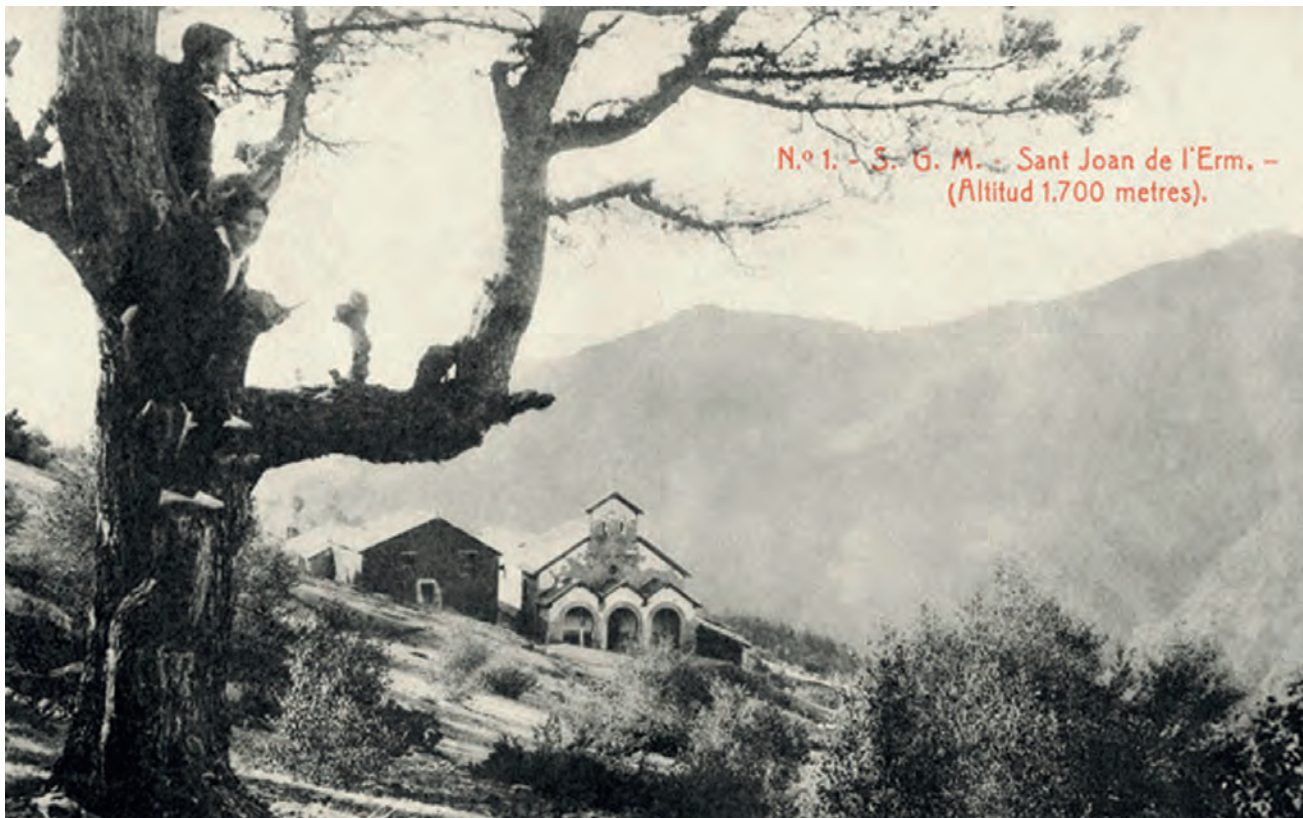
Fotografia de Sant Joan de l'Erm vell

Fa anys, en quatre números de la revista Muntanya (números 851 febrer del 2004 al 854 agost del mateix any), vaig plantejar un estratègic ferrocarril de muntanya de 101 quilòmetres amb la tercera part (33.4 km) de túnels. Anava des de la Pobla de Segur, on ja arriba el ferrocarril, fins al Pont de Suert, per la vall Fosca (Estany Gento, Filià), Manyanet, l'actual estació alpina de Boí-Taüll, el Parc nacional d'Aigües Tortes i el fons de la vall de