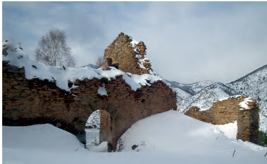
Runes del que queda de l'Erm i el Santuari original, visible a la foto històrica precedent.