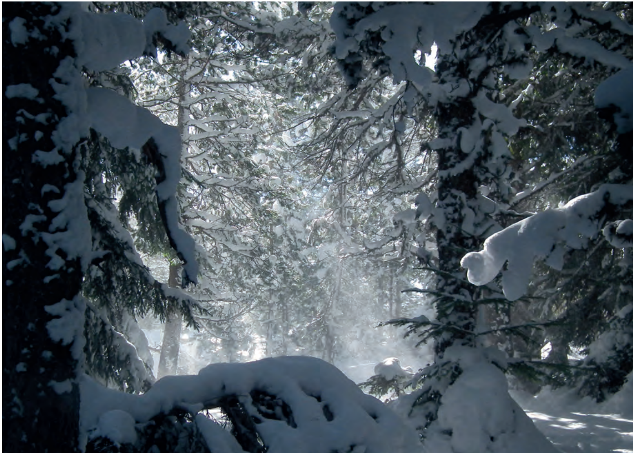
Neu amuntegada a Sant Joan de l'Erm.

revolt de la cota 1.810 m, just a sobre de les Pedres. Així que, qualsevol que volgués, pot fer aquest trajecte, així com el complet pujant des de Castellbò que tantes vegades deuriem haver fet l'Alfons i en Miquel.