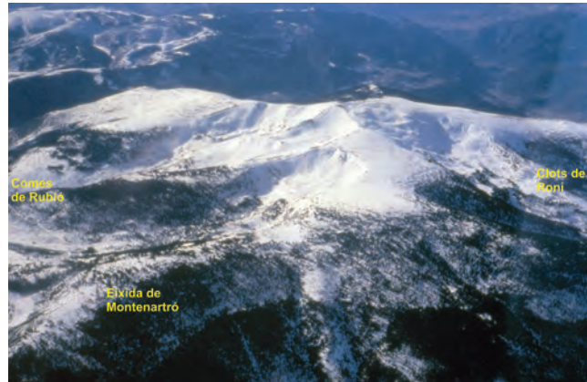
La Torreta de Rubió (2.440 m). A l'esquerra, les Comes de Rubió. A la dreta, els Clots de Roní. Al mig l'ampla carena per on es puja des de l'Eixida de Montenartró en la "Ruta dels bons". Per l'extracció de fusta feta sobre d'ella, a sota es veu la pista del Gallfer.