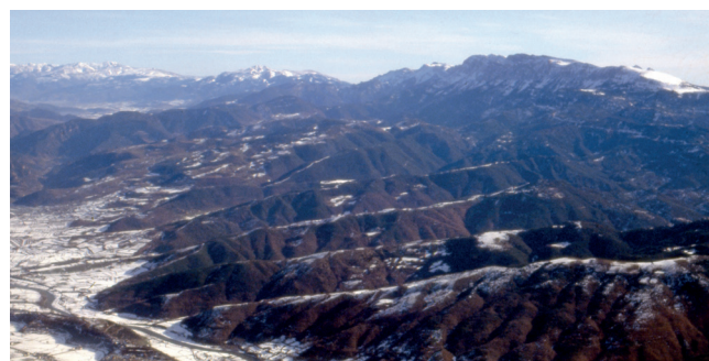
De dreta a esquerra, el Cadí, Moixeró, Puigllaçada (2.409 m) i Tossa d'Alp (2.536 m), Puigmal (2.910 m) amb l'Alt Urgell i la baixa Cerdanya als seus peus. Foto: C. Udina, 28 desembre 1983

el Monteixo (2.905 m) i la Pica d'Estats (3.143 m), el punt més alt de Catalunya. Aquí ja només resta seguir la pista per l'ampla carena, cada vegada amb menys pins i que limita amb la part més alta de l'estació d'esquí alpí de "Port-Ainé", fins arribar a la Torreta (2.440 m), punt més alt de la ruta. La separació de la Torreta de Rubió de l'eix principal pirinenc li dona una perspectiva extraordinària que afegeix tot el Boumort, la Serra del Montsec, la