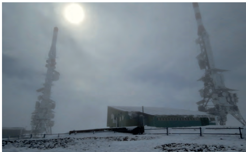
Els dos repetidors a la cota 2440 m, que han substituït l'antiga "Torreta de Rubió".