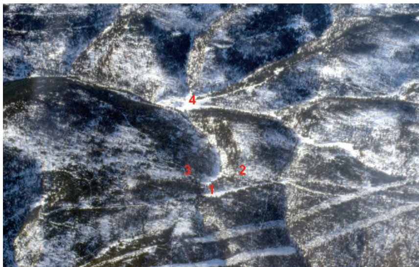
Els suaus lloms dels boscos de Sant Joan de l'Erm, esqueixats per les dues línies elèctriques d'alta tensió. El coll de Leix (1), l'Hospital militar de campanya (2), les trinxeres (3), la casa forestal del Pallerols (4). Foto: C. Udina, 28 desembre 1983

Bosc de la Pega, Planell del Roi (1.600 m). Aquí, just a l'arribar a la carretera d'accés a "Port-Ainé", es perd el camí històric de la guerra civil, que caldria recuperar. L'avantatge és que la carretera va pel mateix lloc els restants 3 km, pujant fins al