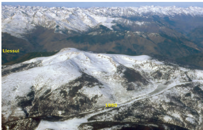
En primer terme, el Prat Muntaner i la Serra Seca, amb pistes d'esquí nòrdic marcades des de la Basseta. Al mig, la Torreta i, al davant, les dues Comes de Rubió amb la seva base a 1.880 m. "Port-Ainé" queda al darrere. En darrer terme, a l'esquerra Llessui (amb menys neu) presidit pel Montsent de Pallars i el Montoroio. Foto: C. Udina, 28 desembre 1983

Baixàvem fins a la cota 2.010 m dels Clots, una mica més amunt d'on avui comença el remuntador principal de "Port-Ainé" amb l'Hotel (1.950 m). Dels 2.010 m remuntàvem 90 metres fins a la cota 2.100 m per la pista que recorre tot l'obac de l'Eixida, baixant a continuació fins a la Culla a 1.930 m. Avui aquest tram no està trepitjat per la màquina de Sant Joan, pel Gall Fer, a qui no convenia el soroll de la