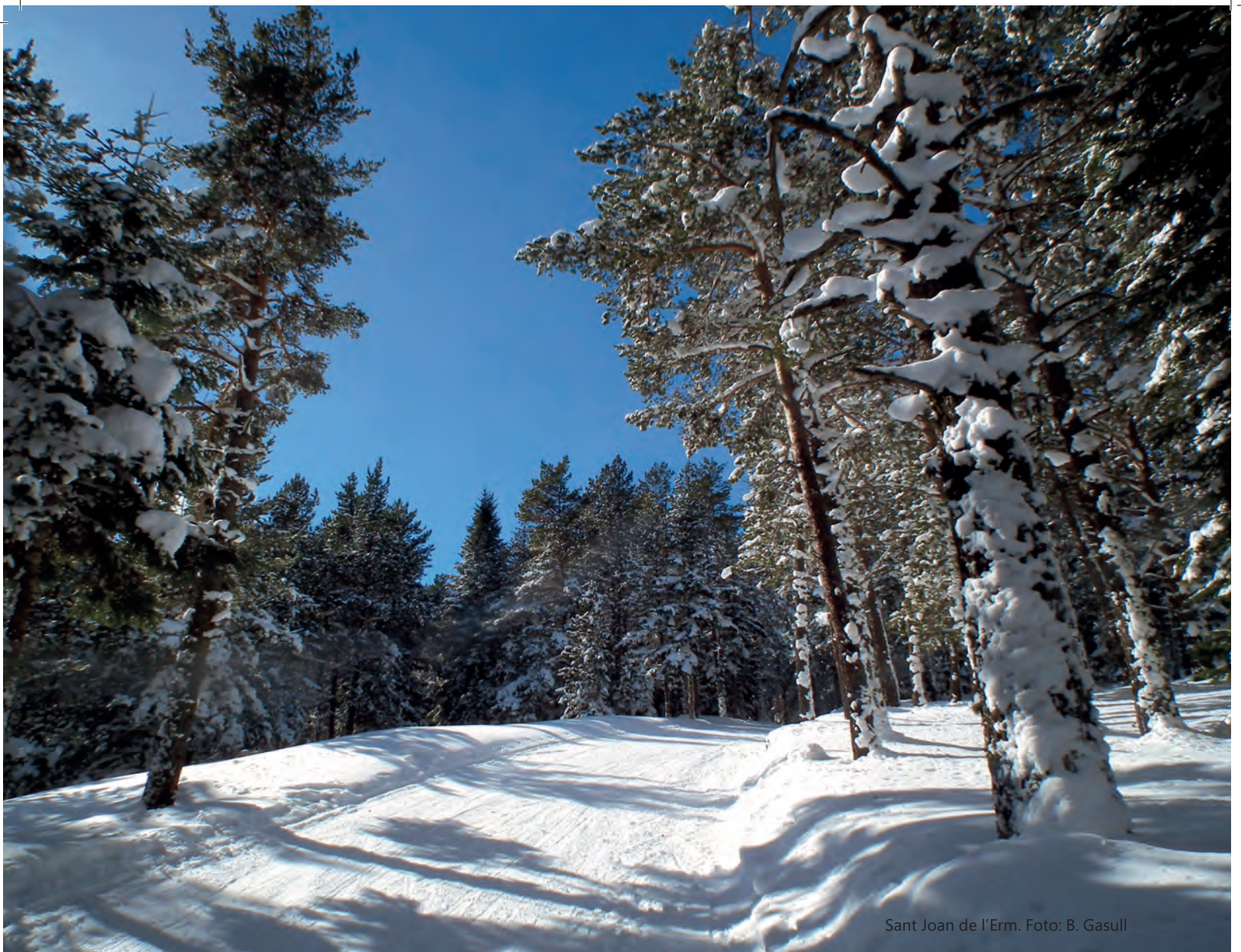
Sant Joan de l'Erm.